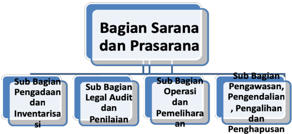
Gambar 3.2 Organisasi Pelaksana Pengelola Sarana Prasarana

Setiap bagian tugas dapat ditempati atau dipegang seorang Kepala Sub Bagian yang secara hierarkis bertanggung jawab kepada kepala bagiannya. Demikian pula kepala bagian bertanggung jawab kepada Kepala Biro yang menangani bagian prasarana dan sarana pendidikan. Struktur organisasi tersebut secara eksplisit dapat