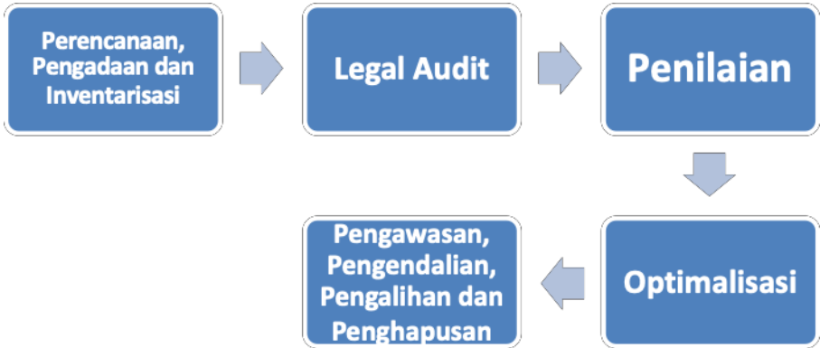
Gambar 3.1 Alur Proses dalam Manajemen Sarana dan Prasarana

. Tahap-tahap dalam alur dalam manajemen sarana dan prasarana dapat digambarkan sebagai berikut.